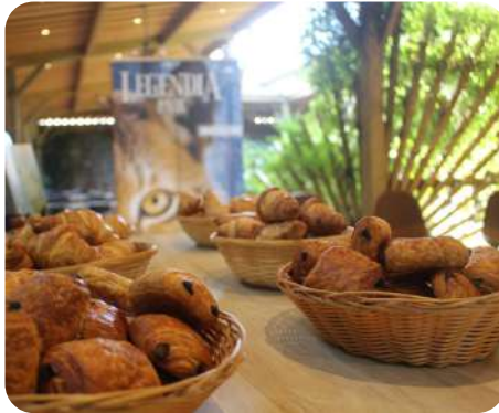
ACCUEIL OU PAUSE GOURMANDE