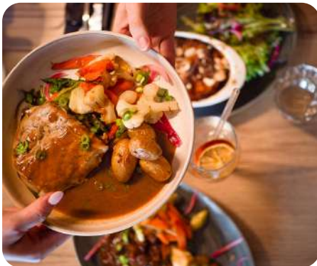
DÉJEUNER OU DÎNER