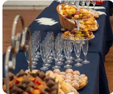
COCKTAIL / BUFFET